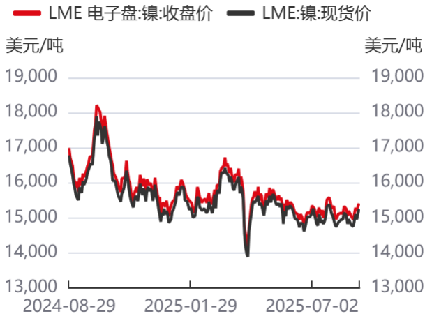
图1: LME收盘价及现货价格 | 单位: 美元/吨