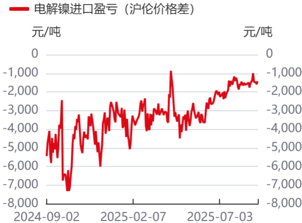
图3: 精炼镍进口盈亏 | 单位: 元/吨