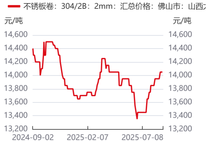
图11：佛山不锈钢卷价格 | 单位：元/吨