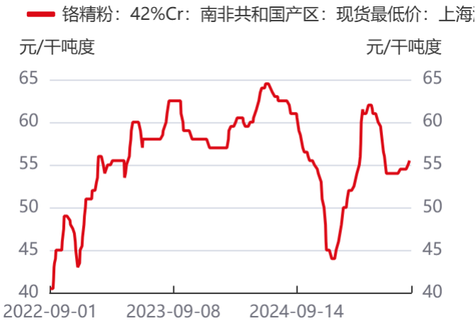
图9：中国主流进口铬矿价格 | 单位：元/千吨