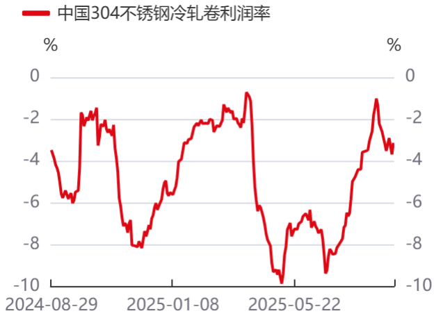
图13: 304不锈钢主流生产利润率 | 单位: %