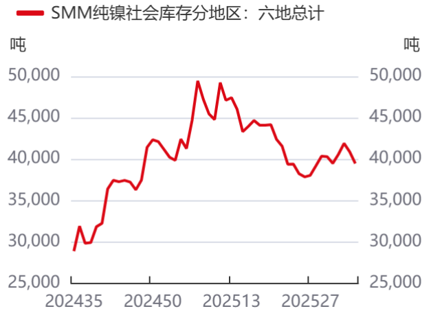
图6: SMM镍六地总库存 | 单位: 吨