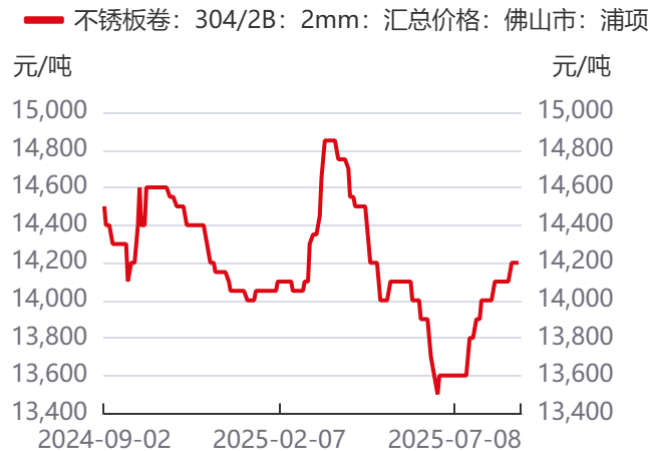
图12：304/2B冷轧不锈钢卷价格 | 单位：元/吨