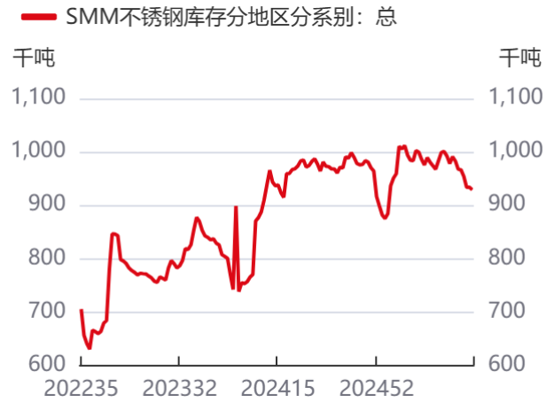
图14: 不锈钢总库存 | 单位: 吨