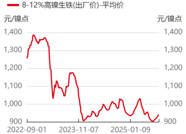
图8：中国主流镍铁价格 | 单位：元/镍点