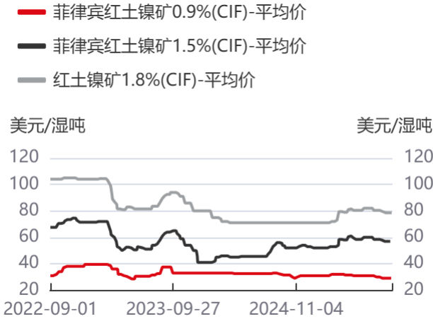
图7：红土镍矿主流报价 | 单位：美元/湿吨