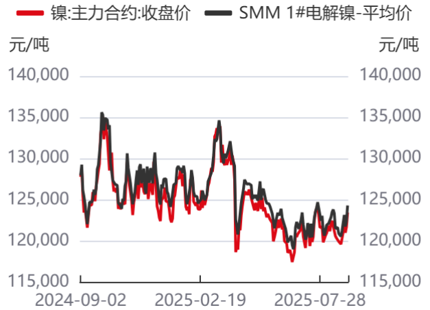
图2: 沪镍主力合约收盘价及SMM现货价格 | 单位: 元/吨