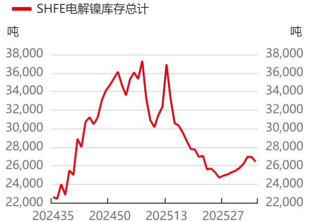
图4: 沪镍仓单 | 单位: 吨