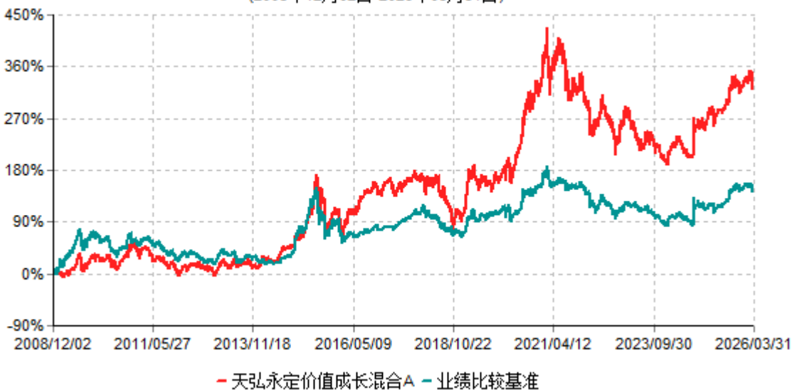
天弘永定价值成长混合A累计净值增长率与业绩比较基准收益率历史走势对比图 (2008年12月02日-2026年03月31日)