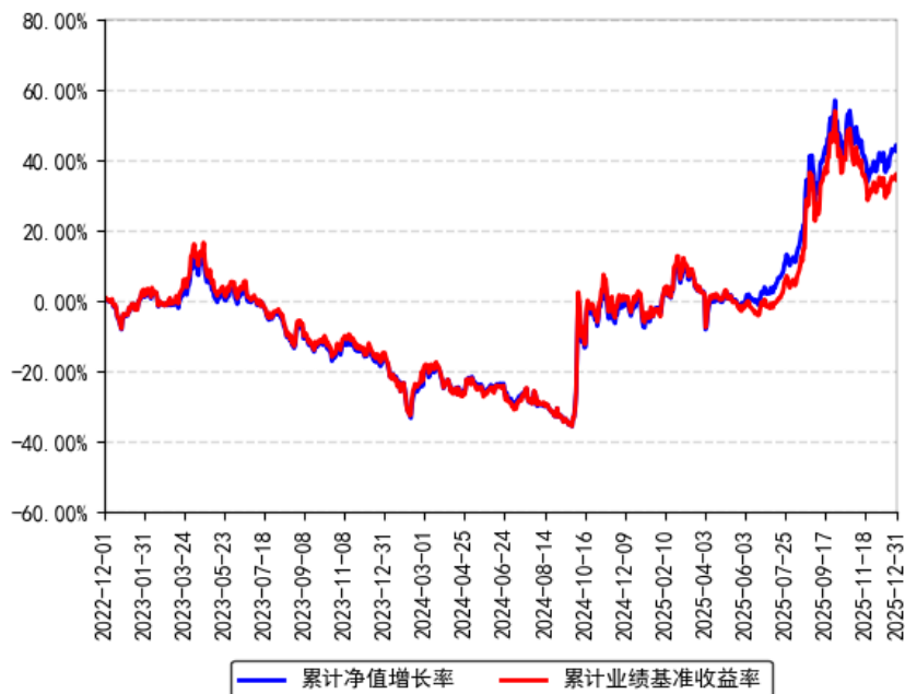
南方上证科创板50成份增强策略ETF累计净值增长率与同期业绩比较基准收益率的历史走势对比图