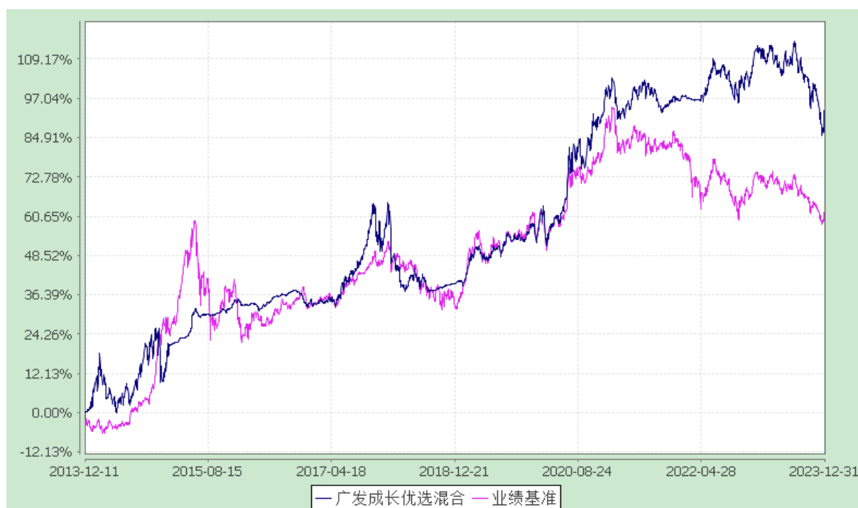
广发成长优选灵活配置混合型证券投资基金 份额累计净值增长率与业绩比较基准收益率的历史走势对比图 (2013 年 12 月 11 日至 2023 年 12 月 31 日)