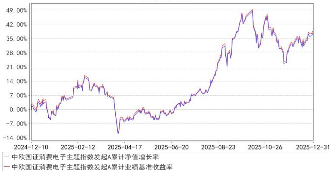
中欧国证消费电子主题指数发起A累计净值增长率与同期业绩比较基准收益率的历史走势对比图

注：本基金基金合同生效日期为 2024 年 12 月 10 日，按基金合同的规定，本基金自基金合同生效起六个月为建仓期，建仓期结束时各项资产配置比例已经符合基金合同约定。