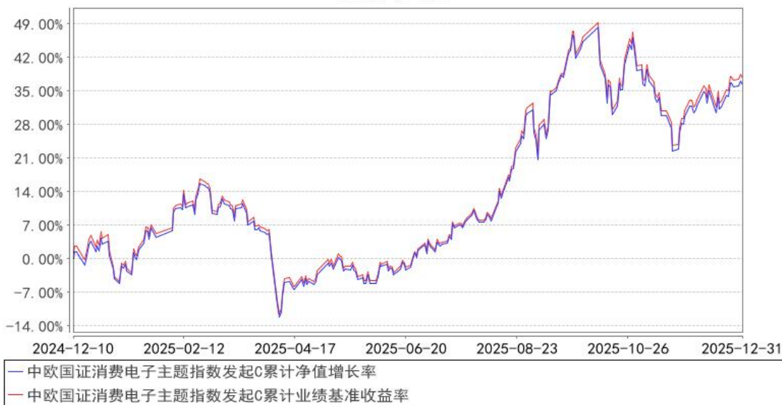
中欧国证消费电子主题指数发起C累计净值增长率与同期业绩比较基准收益率的历史走势对比图

注：本基金基金合同生效日期为 2024 年 12 月 10 日，按基金合同的规定，本基金自基金合同生效之日起六个月为建仓期，建仓期结束时各项资产配置比例已经符合基金合同约定。