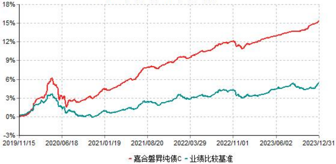
嘉合磐昇纯债C累计净值增长率与业绩比较基准收益率历史走势对比图 (2019年11月15日-2023年12月31日)