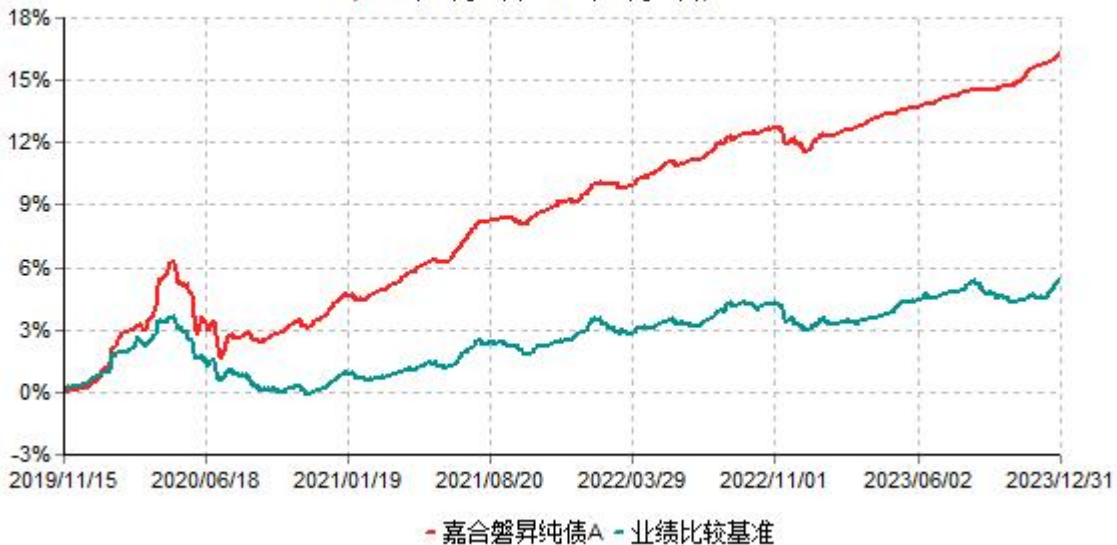
嘉合磐昇纯债A累计净值增长率与业绩比较基准收益率历史走势对比图 (2019年11月15日-2023年12月31日)