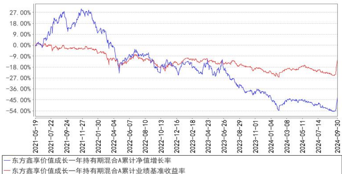
东方鑫享价值成长一年持有期混合A累计净值增长率与同期业绩比较基准收益率的历史走势对比图