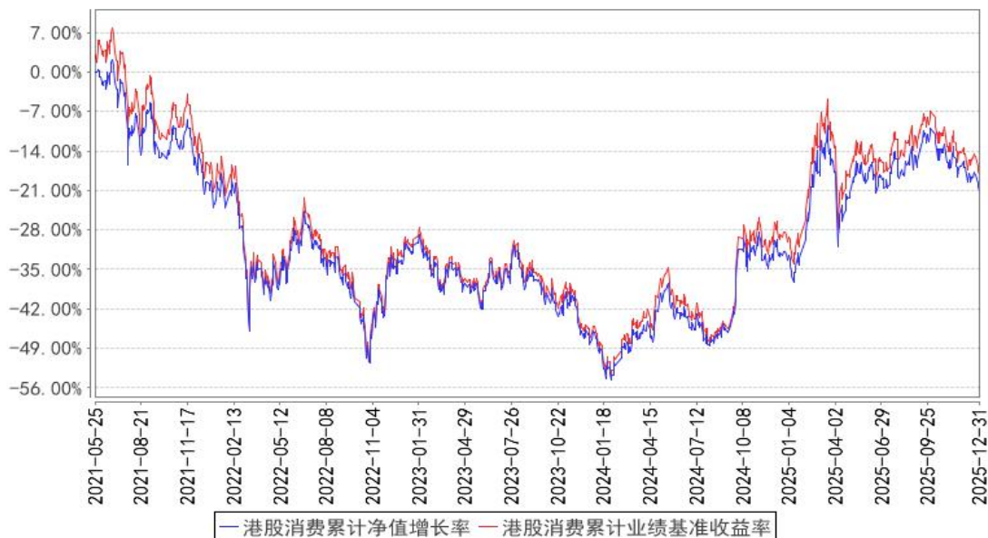
港股消费累计净值增长率与同期业绩比较基准收益率的历史走势对比图

注：按基金合同的规定，本基金自基金合同生效起六个月内为建仓期，建仓期结束时本基金的各项投资比例已达到基金合同的规定：标的指数成份股及备选成份股的资产比例不低于基金资产净值的 90%，且不低于非现金基金资产的 80%，每个交易日日终在扣除股指期货合约、股票期权合约需缴纳的交易保证金后，应当保持不低于交易保证金一倍的现金，其中，现金不包括结算备付金、存出保证金和应收申购款等，因法律法规的规定而受限制的情形除外。