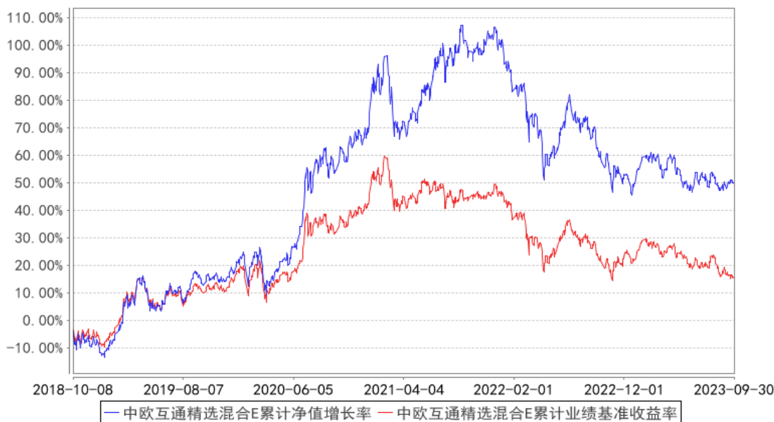
中欧互通精选混合E累计净值增长率与同期业绩比较基准收益率的历史走势对比图

注：自 2018 年 10 月 8 日起，原中欧沪深 300 指数增强型证券投资基金转型为中欧互通精选混合型证券投资基金。图示为 2018 年 10 月 8 日至 2023 年 09 月 30 日。