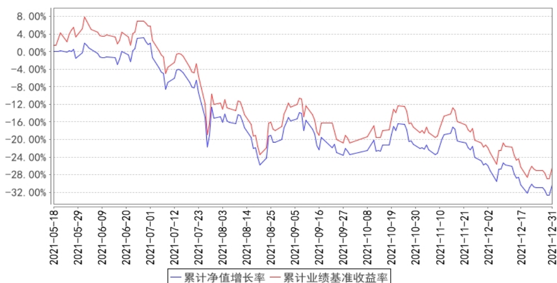
大成恒生科技ETF（QDII）累计净值增长率与同期业绩比较基准收益率的历史走势对比图

注：1、本基金合同生效日为2021年5月18日，截止报告期末本基金合同生效未满一年。