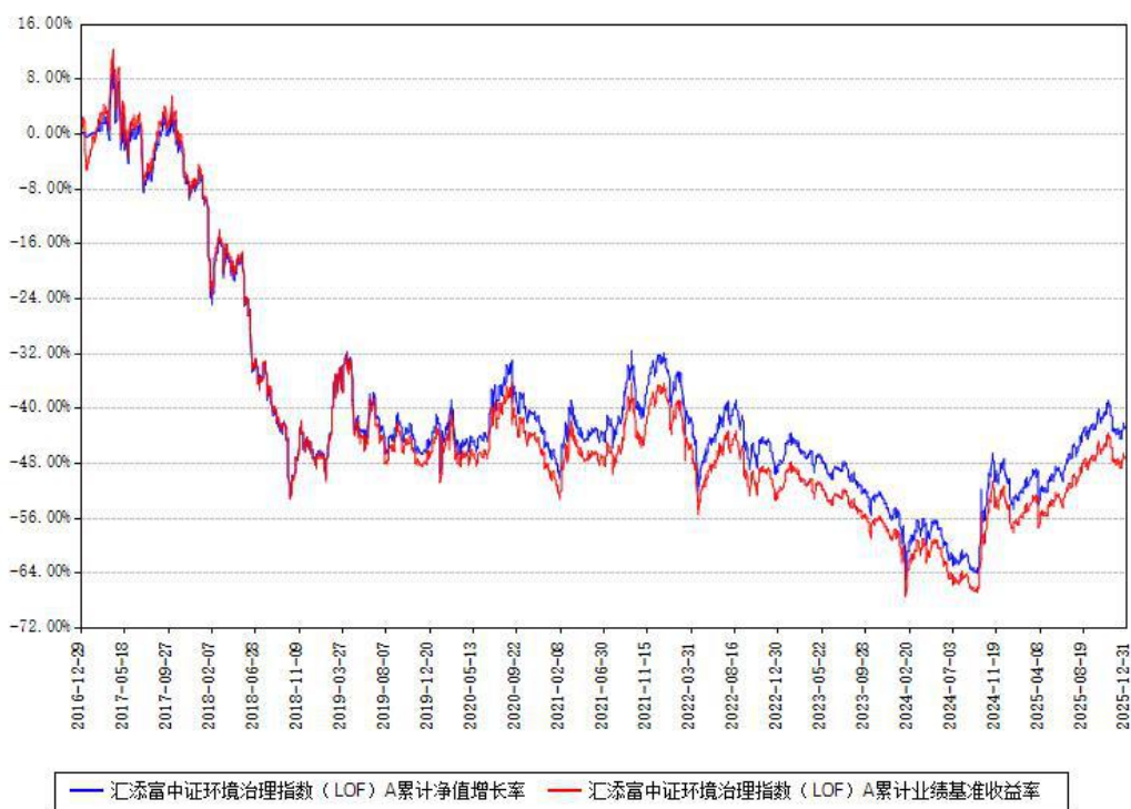
汇添富中证环境治理指数（LOF）A累计净值增长率与同期业绩基准收益率对比图