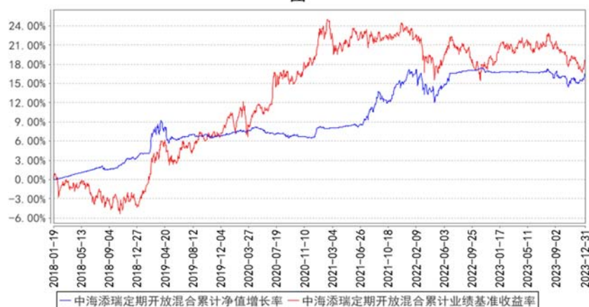
中海添瑞定期开放混合累计净值增长率与同期业绩比较基准收益率的历史走势对比图