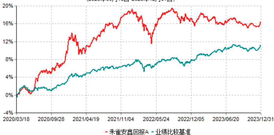
朱雀安鑫回报A累计净值增长率与业绩比较基准收益率历史走势对比图 (2020年03月18日-2023年12月31日)