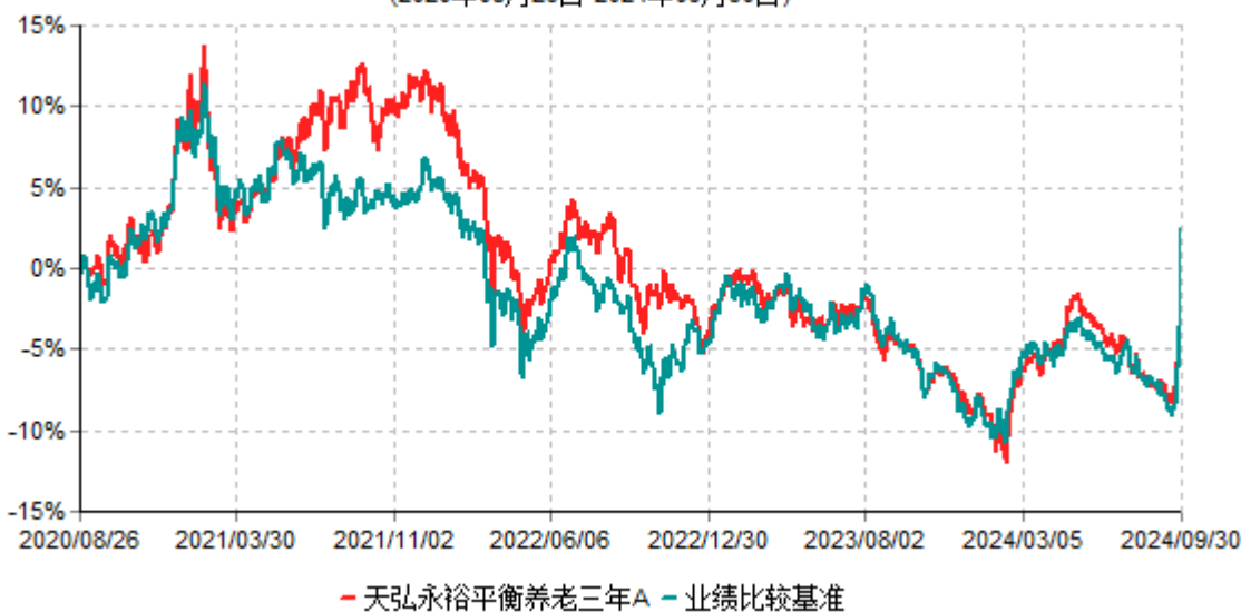
天弘永裕平衡养老三年A累计净值增长率与业绩比较基准收益率历史走势对比图 (2020年08月26日-2024年09月30日)