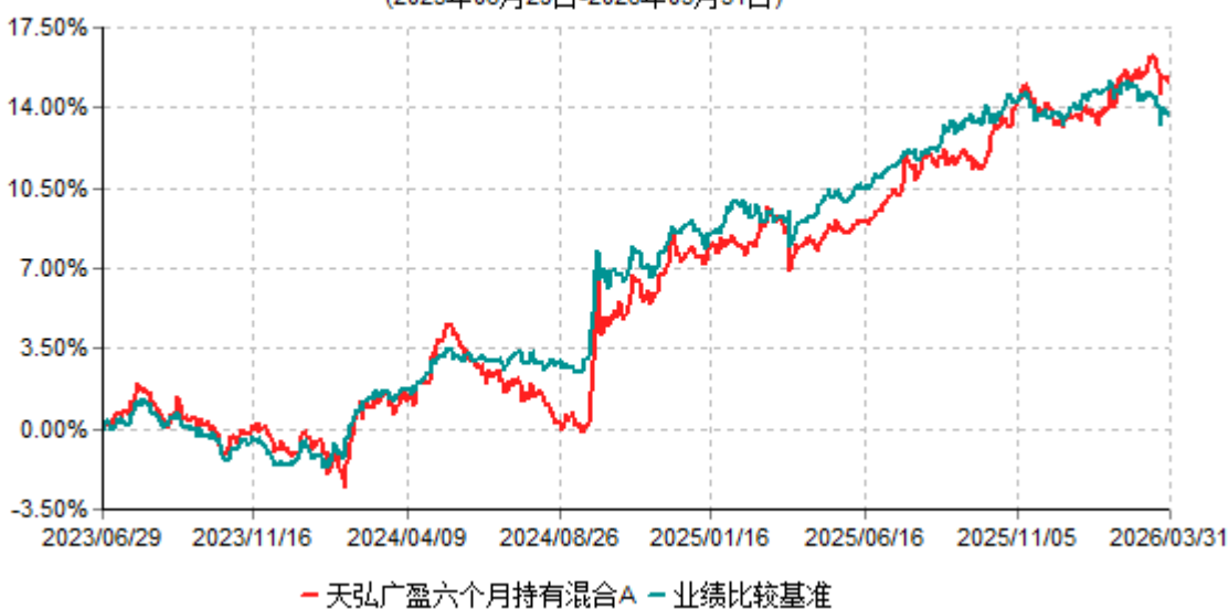
天弘广盈六个月持有混合A累计净值增长率与业绩比较基准收益率历史走势对比图 (2023年06月29日-2026年03月31日)