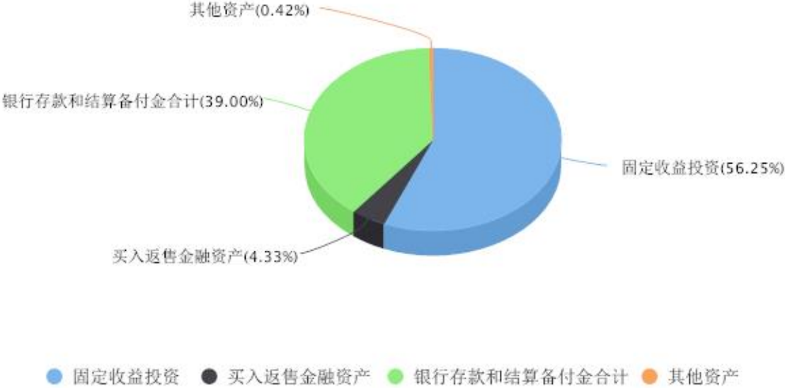
投资组合资产配置图表 数据截止日期:2023年09月30日