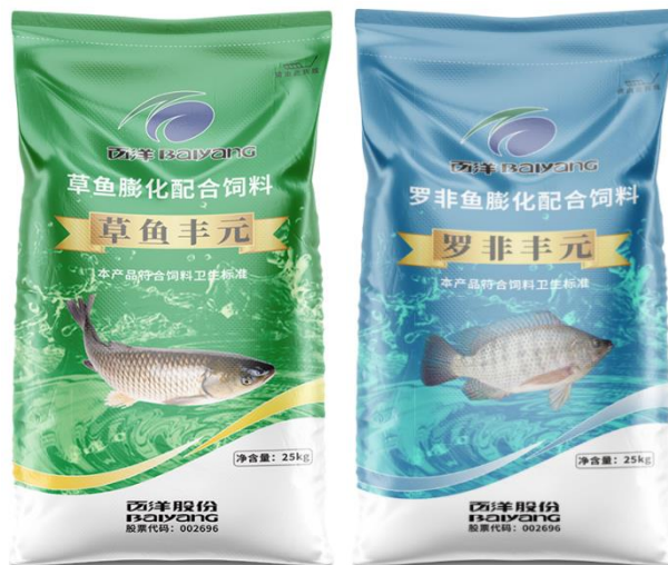
公司部分普水料产品

公司普通水产饲料产品以罗非鱼料和草鱼料等为代表的淡水鱼饲料为主。产品品质稳定，高中低档次齐全，适应不同市场不同客户群体选择。