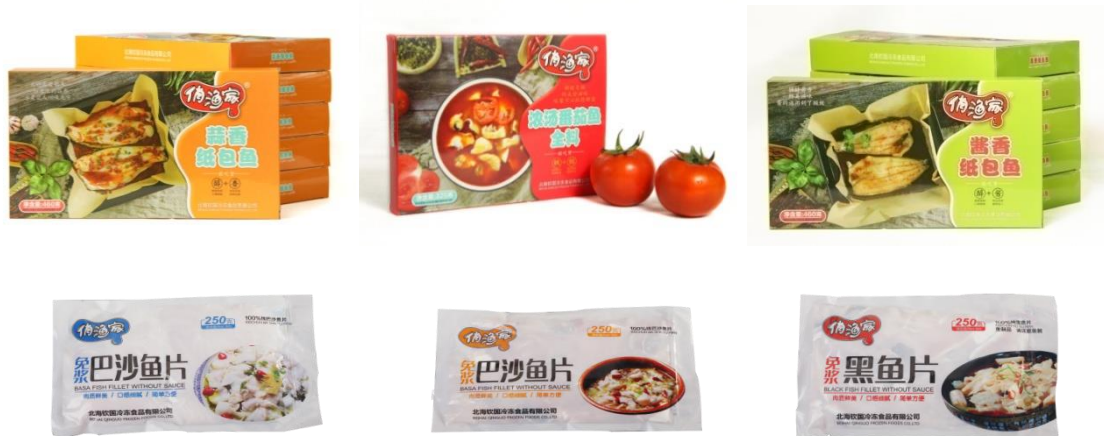
公司“俏渔家”品牌部分产品

“俏渔家”系列产品已拥有免浆带皮巴沙鱼片、免浆去皮巴沙鱼片、免浆黑鱼片、免浆鲷鱼片、青虾仁、水煮汉虾等品种。