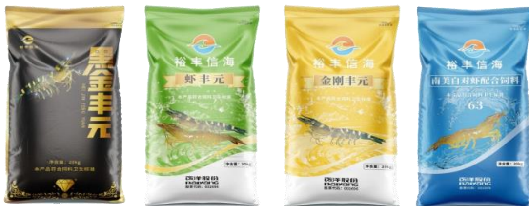
公司部分虾饲料产品

虾饲料产品是公司未来重点发力的产品品类之一。目前已开发出了“黑金丰元”、“金刚丰元”、“虾丰元”等一系列产品，能够满足金刚虾、白对虾、斑节对虾等不同虾种的养殖需求，能够适应高位池高密度养殖、土塘低密度养殖、土塘鱼虾混养、低温冬棚养殖等不同养殖环境模式。公司的虾饲料产品具有耐水性好，诱食性好等优点。