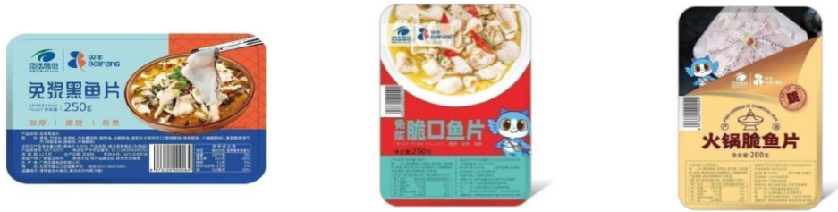
公司“贝丰”品牌部分产品

“俏渔家”系列产品已拥有免浆带皮巴沙鱼片、免浆去皮巴沙鱼片、免浆黑鱼片、免浆鲷鱼片、青虾仁、水煮汉虾等品种。