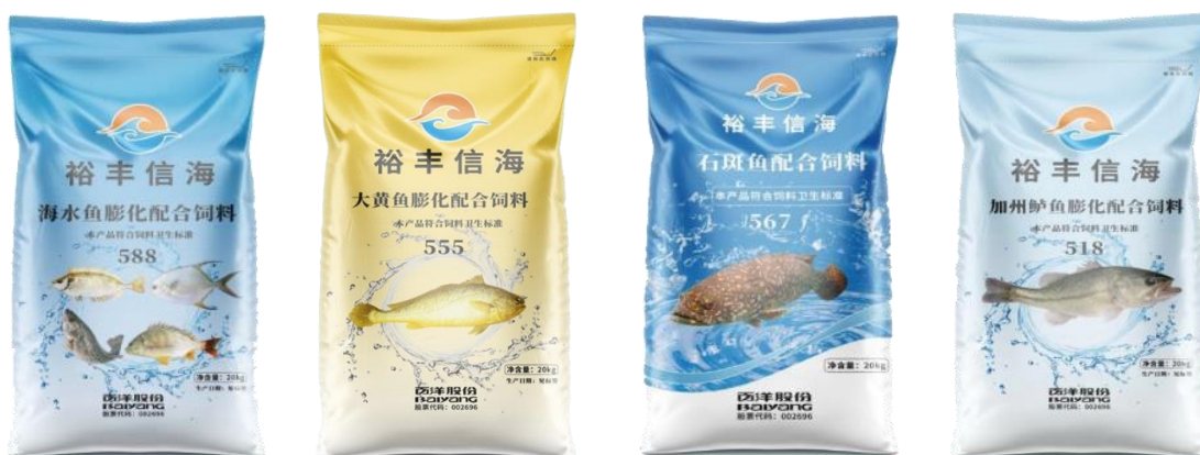
公司部分特种水产饲料产品

等鱼种的系列产品，还配套研发“肝肠丰元”系列产品用于改善鱼类肝脏问题，促进肠道发育。此外，公司还有少量的蛙类饲料产品。