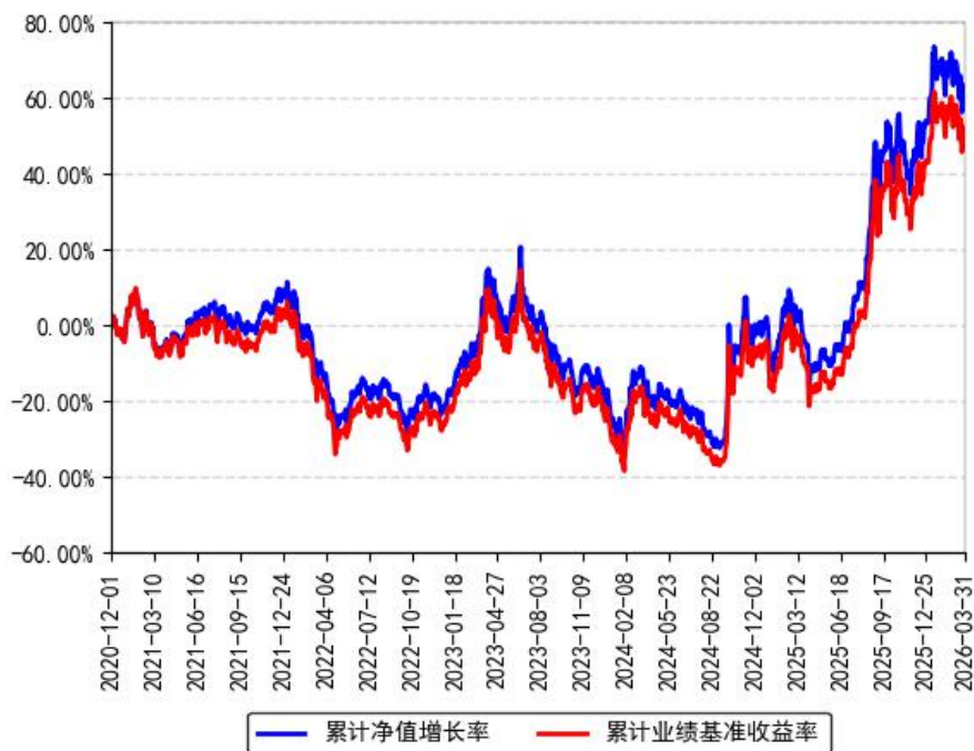
南方中证互联网指数（LOF）A累计净值增长率与同期业绩比较基准收益率的历史走势对比图