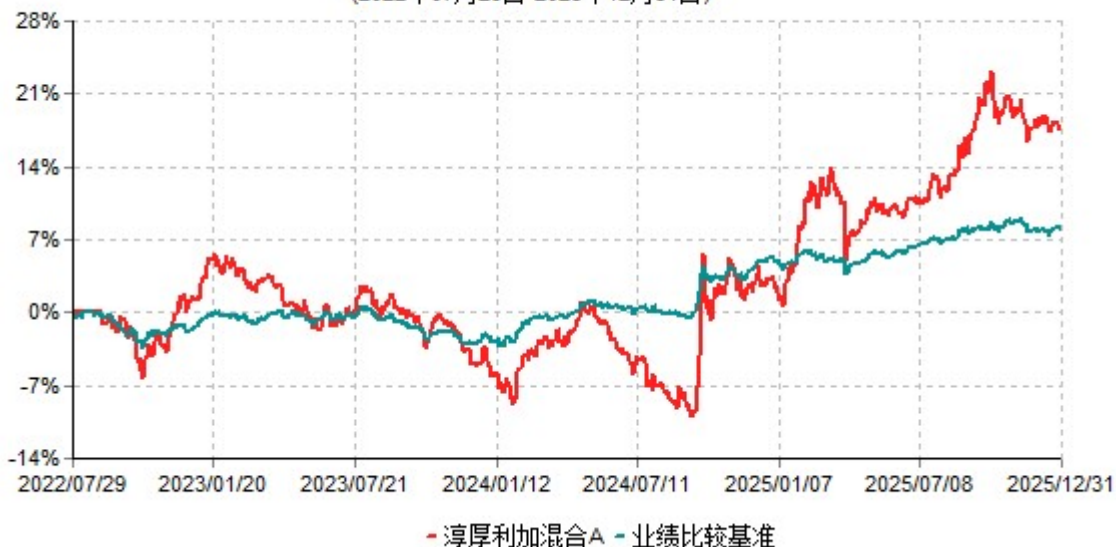
淳厚利加混合A累计净值增长率与业绩比较基准收益率历史走势对比图 (2022年07月29日-2025年12月31日)

注：本基金基金合同生效日为2022年07月29日。按基金合同规定，本基金自基金合同生效起6个月内为建仓期。建仓期结束时本基金的各项投资比例均符合基金合同约定。