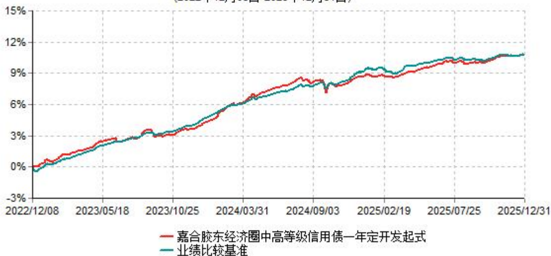
嘉合胶东经济圈中高等级信用债一年定开发起式累计净值增长率与业绩比较基准收益率历史走势对比图 (2022年12月08日-2025年12月31日)