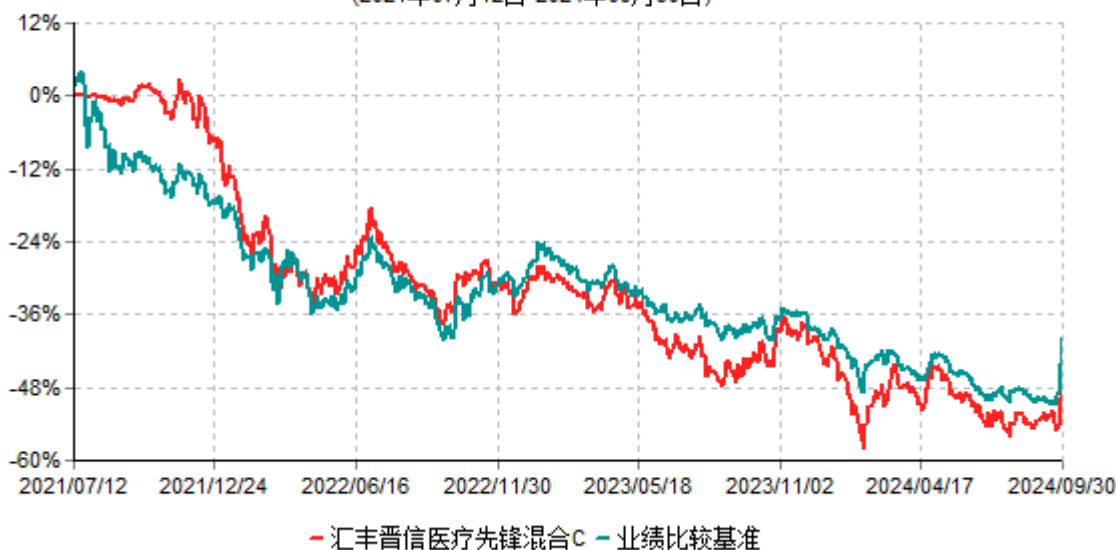
汇丰晋信医疗先锋混合C累计净值增长率与业绩比较基准收益率历史走势对比图 (2021年07月12日-2024年09月30日)

4、上述基金净值增长率的计算已包含本基金所投资股票在报告期产生的股票红利收益。同期业绩比较基准收益率的计算未包含中证医药卫生指数、恒生医疗保健指数成份股在报告期产生的股票红利收益。同期业绩比较基准收益率的计算未计入汇率对恒生医疗保健指数的影响。本基金业绩比较基准中的中债新综合全价指数为中债新综合全价（总值）指数收益率，是以债券全价计算的指数值，债券付息后利息不再计入指数之中。