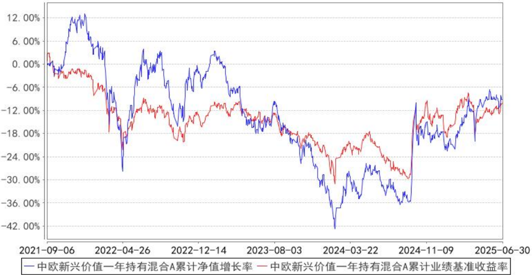
中欧新兴价值一年持有混合A累计净值增长率与同期业绩比较基准收益率的历史走势对比图