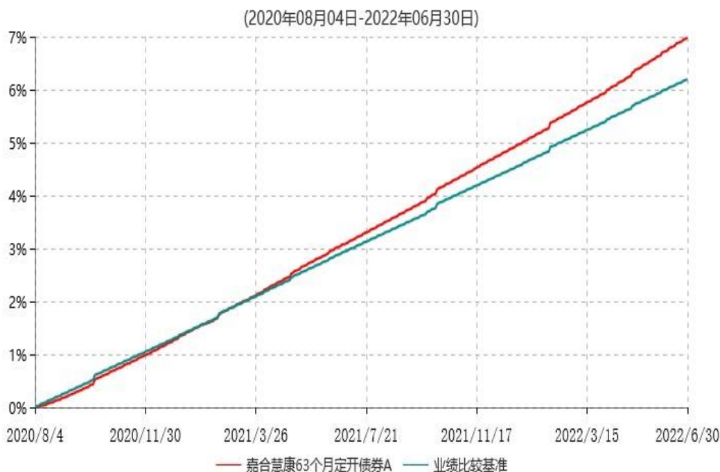
嘉合慧康63个月定开债券A累计净值增长率与业绩比较基准收益率历史走势对比图