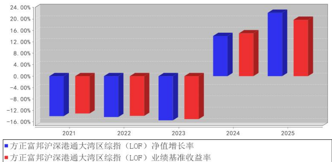
方正富邦沪深港通大湾区综指（LOF）基金每年净值增长率与同期业绩比较基准收益率的对比图