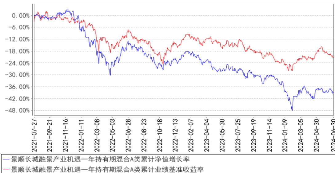
景顺长城融景产业机遇一年持有期混合A类累计净值增长率与同期业绩比较基准收益率的历史走势对比图