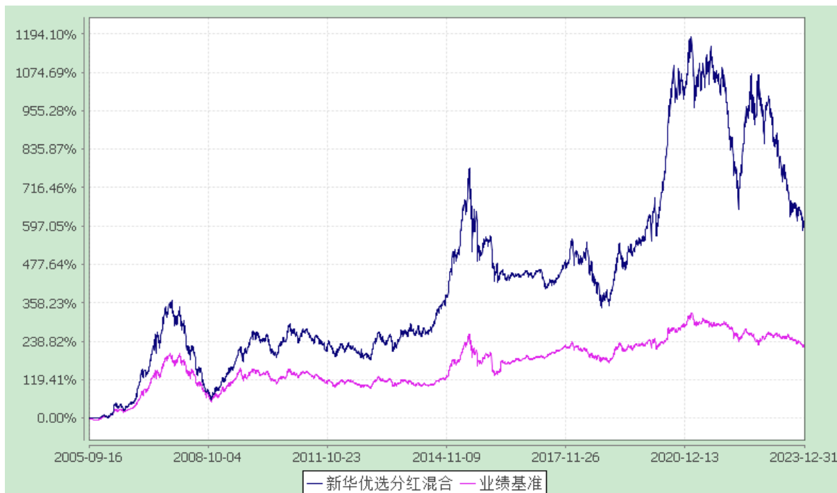
自基金合同生效以来份额累计净值增长率与业绩比较基准收益率的历史走势对比图 (2005 年 9 月 16 日至 2023 年 12 月 31 日)

注：本基金于 2005 年 9 月 16 日基金合同生效，报告期内本基金的各项资产配置比例符合基金合同的有关约定。