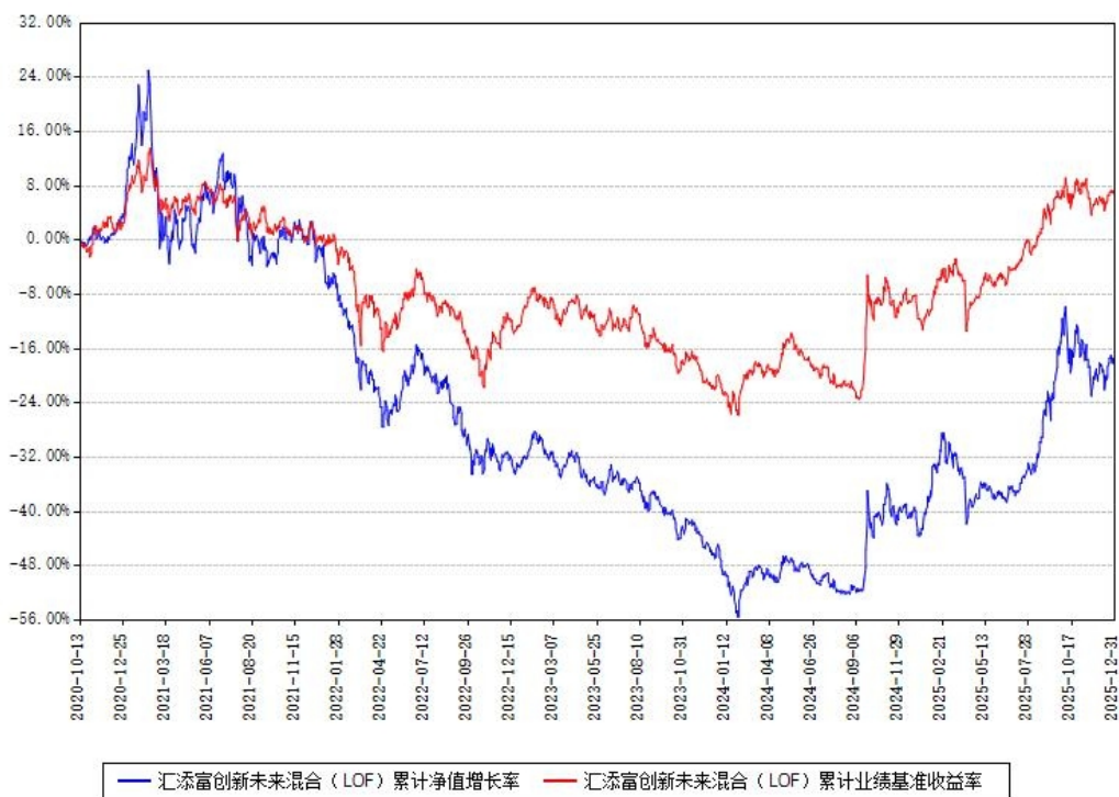
汇添富创新未来混合（LOF）累计净值增长率与同期业绩比较基准收益率对比图

注：本基金建仓期为本《基金合同》生效之日（2020年10月13日）起6个月，建仓期结