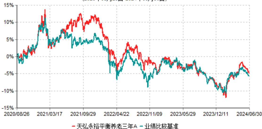
天弘永裕平衡养老三年A累计净值增长率与业绩比较基准收益率历史走势对比图 (2020年08月26日-2024年06月30日)