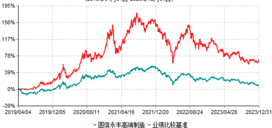
圆信永丰高端制造混合型证券投资基金累计净值增长率与业绩比较基准收益率历史走势对比图 (2019年04月04日-2023年12月31日)