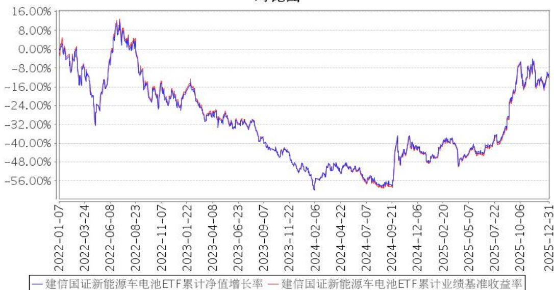
建信国证新能源车电池ETF累计净值增长率与同期业绩比较基准收益率的历史走势对比图