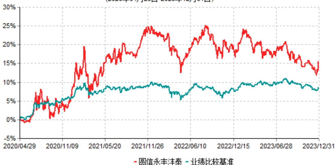
圆信永丰沅泰混合型证券投资基金累计净值增长率与业绩比较基准收益率历史走势对比图 (2020年04月29日-2023年12月31日)