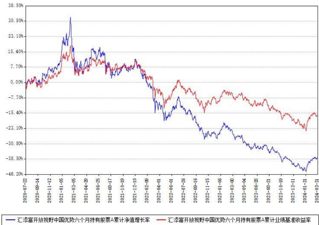
汇添富开放视野中国优势六个月持有股票A累计净值增长率与同期业绩基准收益率对比图