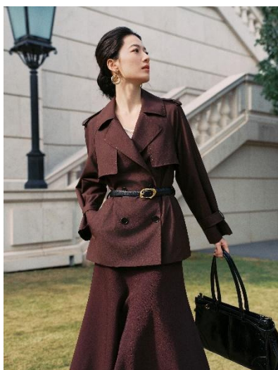
JZ 玖姿 品牌风格及店铺形象