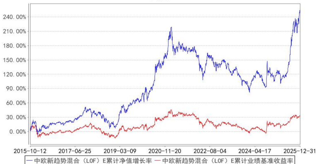
中欧新趋势混合 (LOF) E 累计净值增长率与同期业绩比较基准收益率的历史走势对比图

注：本基金于 2015 年 10 月 8 日新增 E 类份额，图示日期为 2015 年 10 月 12 日至 2025 年 12 月 31 日。