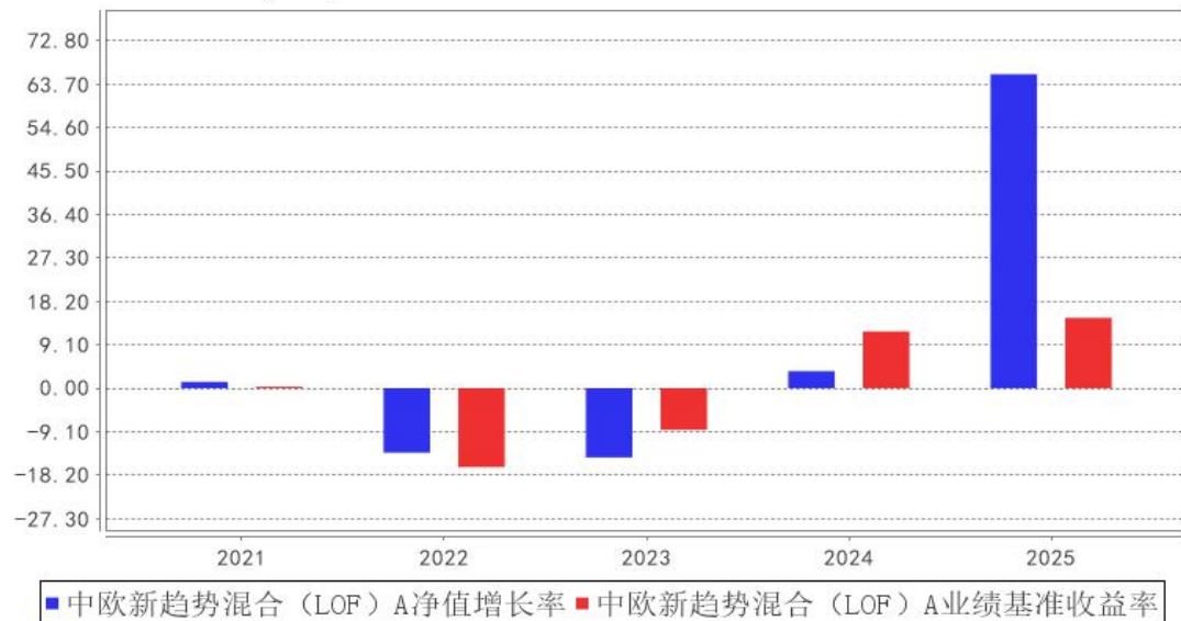
中欧新趋势混合 (LOF) A 基金每年净值增长率与同期业绩比较基准收益率的对比图