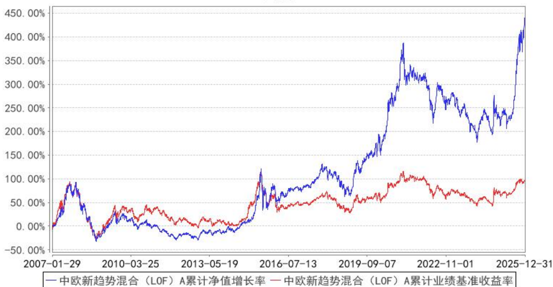
中欧新趋势混合（LOF）A 累计净值增长率与同期业绩比较基准收益率的历史走势对比图