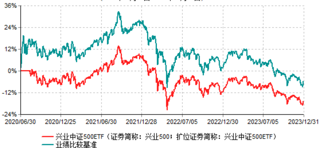
兴业中证500交易型开放式指数证券投资基金累计净值增长率与业绩比较基准收益率历史走势对比图 (2020年06月30日-2023年12月31日)