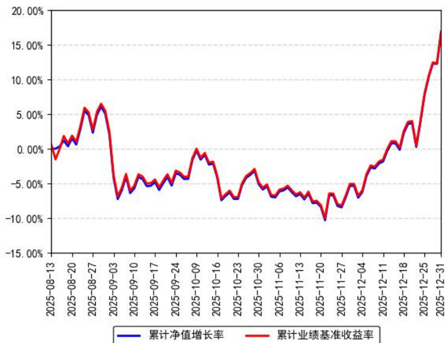
南方中证通用航空主题ETF累计净值增长率与同期业绩比较基准收益率的历史走势对比图

注：本基金合同于 2025 年 8 月 13 日生效，截至本报告期末基金成立未满一年；自基金成立日起 6 个月内为建仓期，截至报告期末建仓期尚未结束。