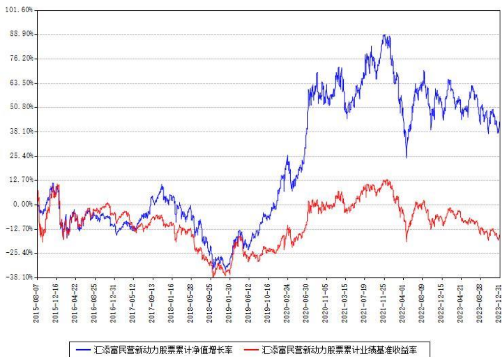
汇添富民营新动力股票累计净值增长率与同期业绩比较基准收益率对比图

注：本基金建仓期为本《基金合同》生效之日（2015年08月07日）起6个月，建仓期结束时各项资产配置比例符合合同约定。