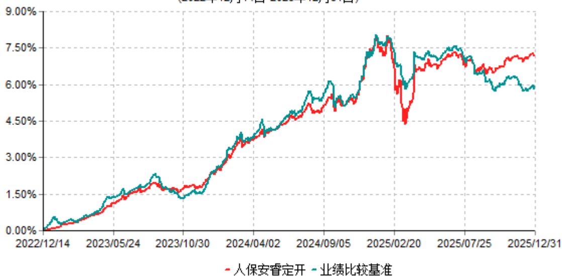
人保安睿定开累计净值增长率与业绩比较基准收益率历史走势对比图 (2022年12月14日-2025年12月31日)