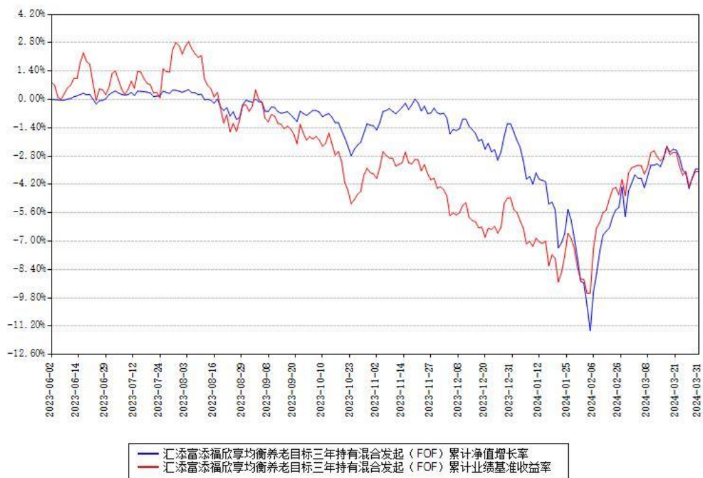
汇添富添福欣享均衡养老目标三年持有混合发起（FOF）累计净值增长率与同期业绩基准收益率对比图