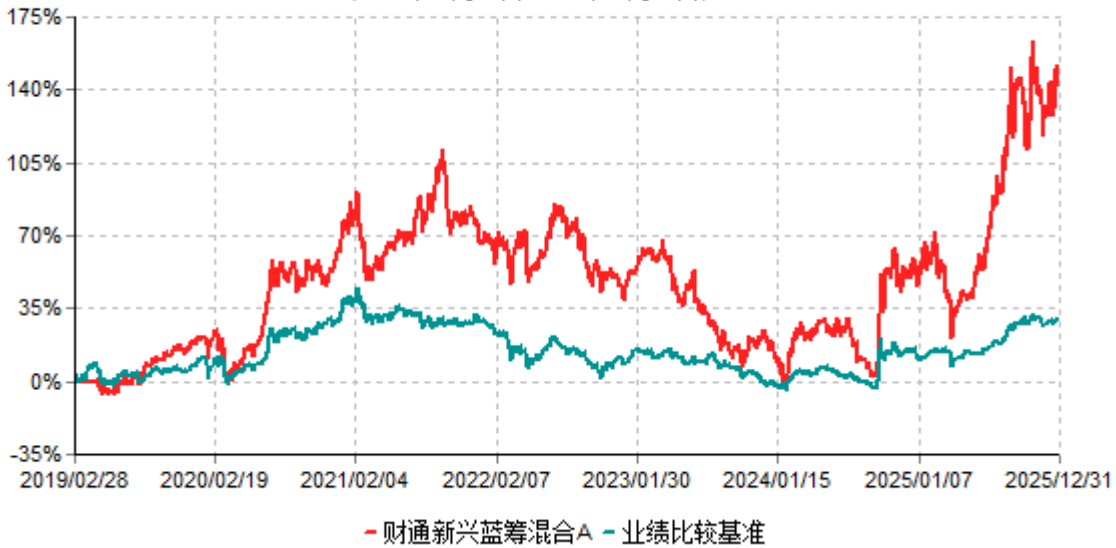
财通新兴蓝筹混合A累计净值增长率与业绩比较基准收益率历史走势对比图 (2019年02月28日-2025年12月31日)