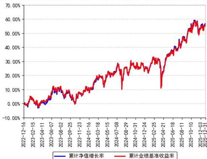
南方基金南方东英富时亚太低碳精选ETF（QDII）累计净值增长率与同期业绩比较基准收益率的历史走势对比图