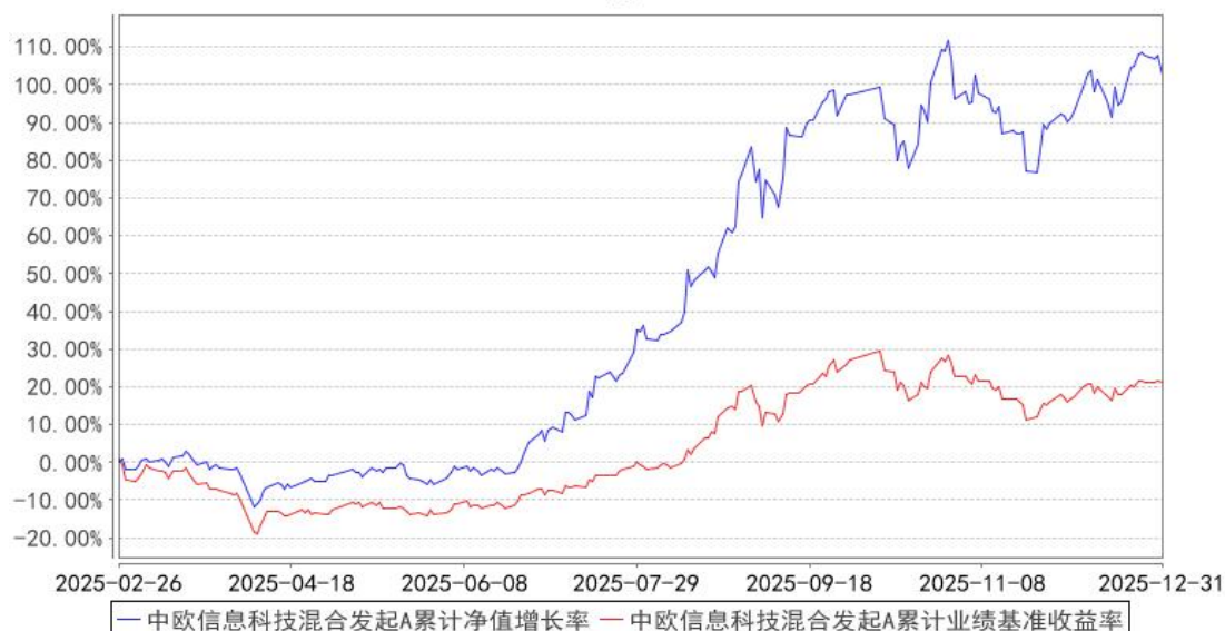
中欧信息科技混合发起A累计净值增长率与同期业绩比较基准收益率的历史走势对比图

注：本基金基金合同生效日期为 2025 年 2 月 26 日，自基金合同生效日起到本报告期末不满一年，按基金合同的规定，本基金自基金合同生效起六个月为建仓期，建仓期结束时各项资产配置比例已经符合基金合同约定。