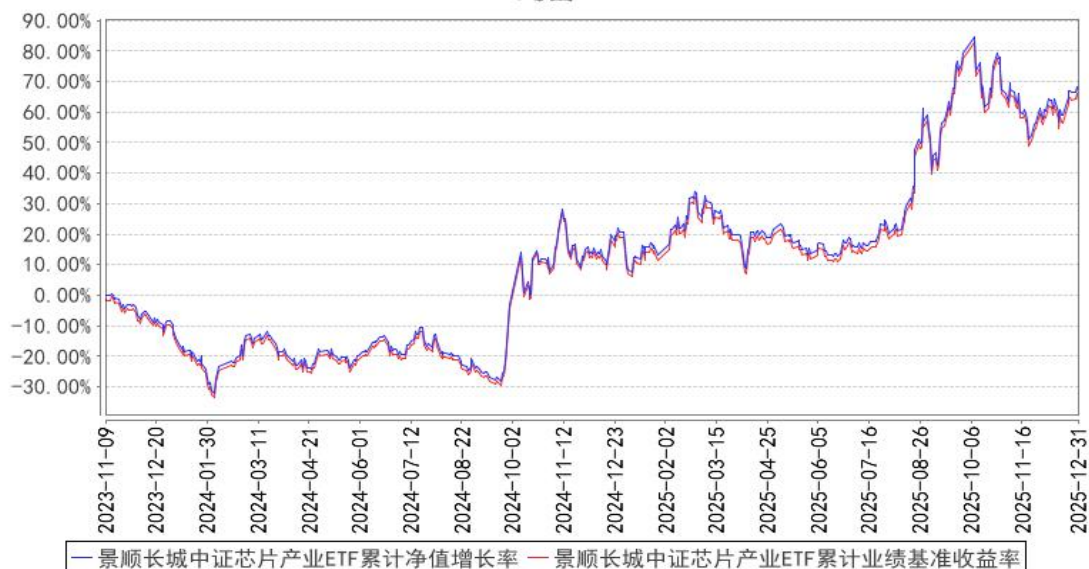
景顺长城中证芯片产业ETF累计净值增长率与同期业绩比较基准收益率的历史走势对比图

注：基金的投资组合比例为：基金投资于标的指数成份股及备选成份股的资产不低于基金资产净值的90%，且不低于非现金基金资产的80%，因法律法规的规定而受限制的情形除外。本基金每个交易日日终在扣除股指期货合约、股票期权合约需缴纳的交易保证金后，应当保持不低于交易保证金一倍的现金，其中，现金不包括结算备付金、存出保证金和应收申购款等。本基金的建仓