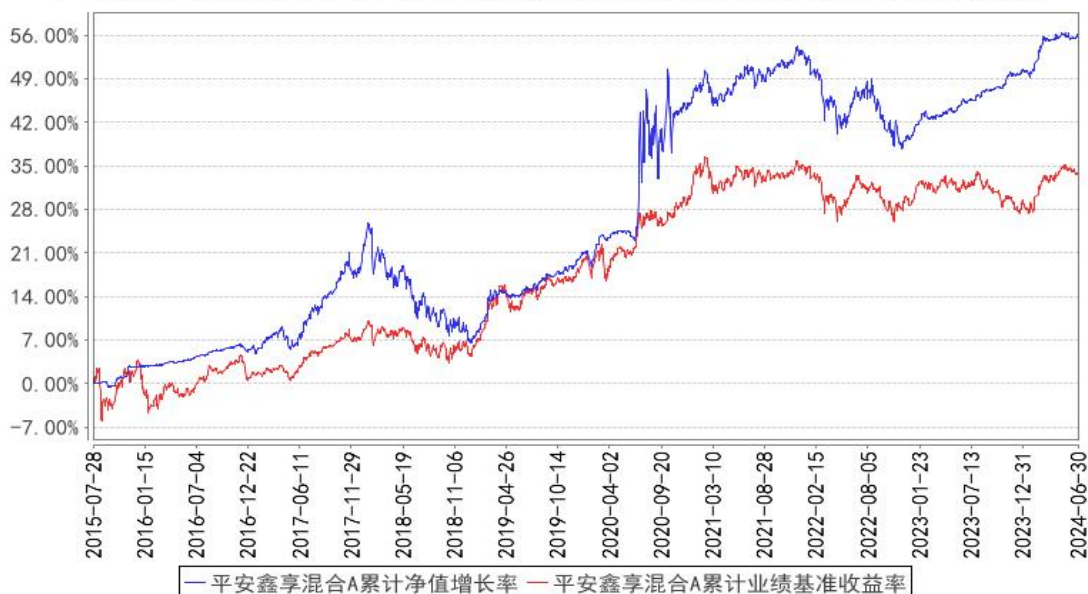
平安鑫享混合A累计净值增长率与同期业绩比较基准收益率的历史走势对比图