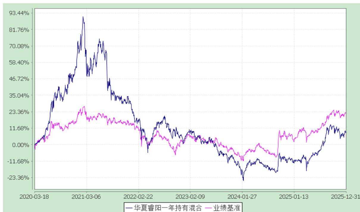
华夏睿阳一年持有期混合型证券投资基金 份额累计净值增长率与业绩比较基准收益率历史走势对比图 (2020年3月18日至2025年12月31日)