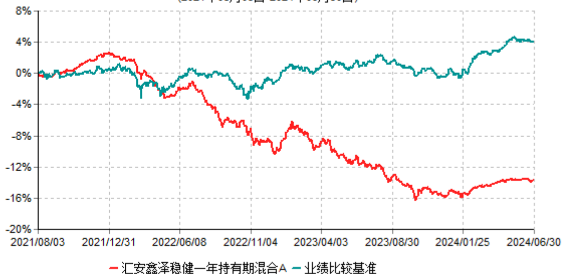
汇安鑫泽稳健一年持有期混合A累计净值增长率与业绩比较基准收益率历史走势对比图 (2021年08月03日-2024年06月30日)