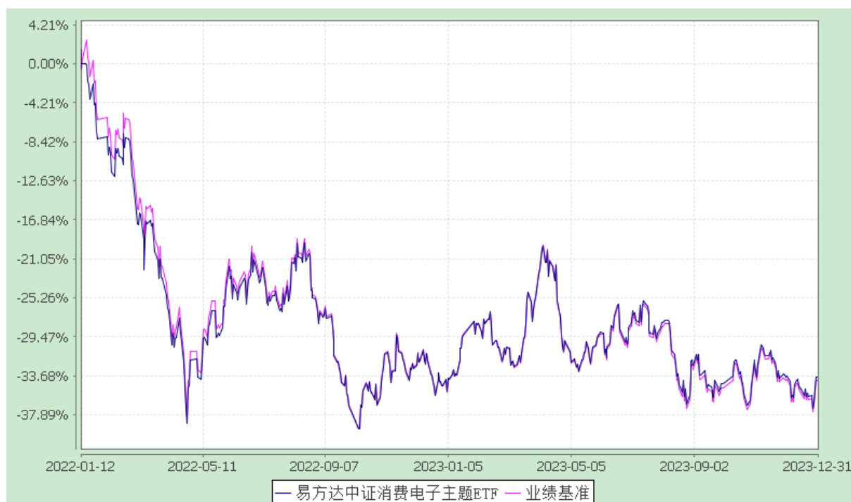
易方达中证消费电子主题交易型开放式指数证券投资基金 份额累计净值增长率与业绩比较基准收益率历史走势对比图 (2022 年 1 月 12 日至 2023 年 12 月 31 日)

注：自基金合同生效至报告期末，基金份额净值增长率为-33.85%，同期业绩比较基准收益率为-34.21%。