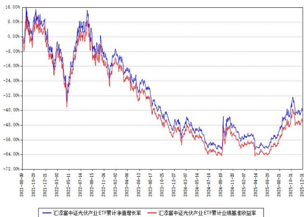
汇添富中证光伏产业ETF累计净值增长率与同期业绩比较基准收益率对比图

注：本基金建仓期为本《基金合同》生效之日（2021年08月09日）起6个月，建仓期结束时各项资产配置比例符合合同约定。