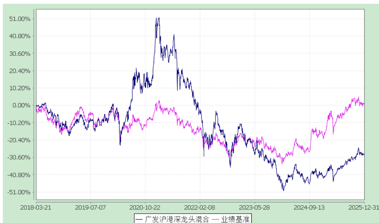
广发沪港深行业龙头混合型证券投资基金 份额累计净值增长率与业绩比较基准收益率的历史走势对比图 (2018 年 3 月 21 日至 2025 年 12 月 31 日)