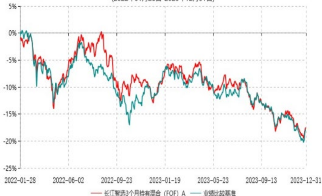
长江智选3个月持有混合（FOF）A累计净值增长率与业绩比较基准收益率历史走势对比图 (2022年01月28日-2023年12月31日)

注：（1）本基金的业绩比较基准自2023年11月17日起由“沪深300指数收益率*70%+中债-综合全价（总值）指数收益率*30%”变更为“中证金选偏股基金策略指数收益率*90%+中债-综合全价（总值）指数收益率*10%”